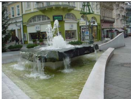
Brunnenanlage aus Carraramarmor Leopoldsplatz