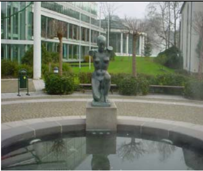
Caracalla-Therme (am Eingang)