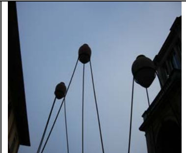
Markplatz (Zwischen Altes Dampfbad und Friedrichsbad)