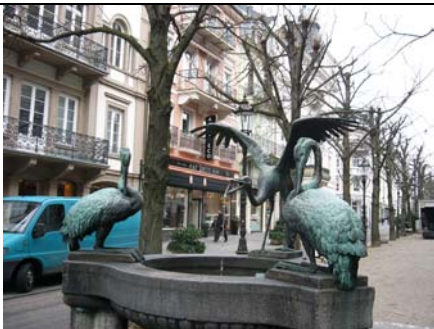
Der Reiherbrunnen Sophienstraße