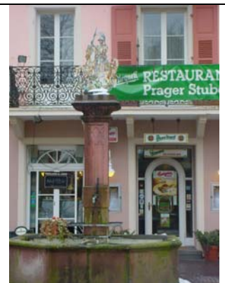
Sankt Georgs-Brunnen Römerplatz