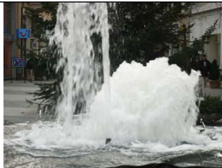
Brunnenanlage aus Carraramarmor Leopoldsplatz