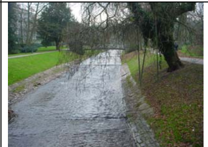
Oosbach (neben der Kaiserallee)